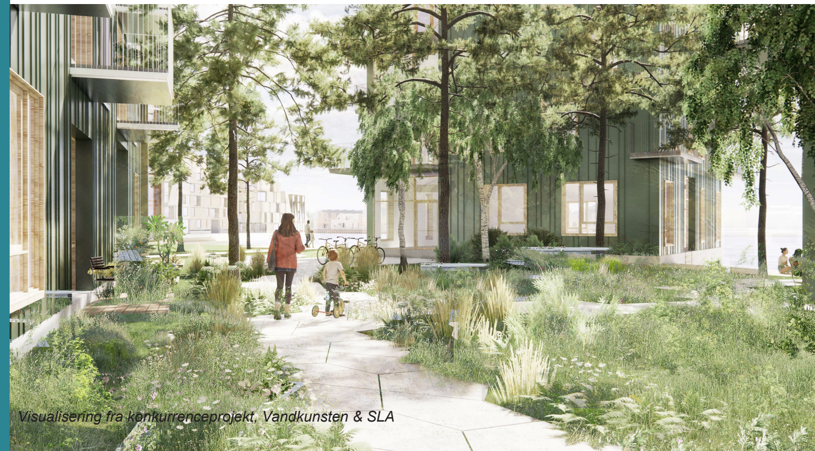
Visualisering fra konkurrenceprojekt, Vandkunsten & SLA

Bebyggelserne i områdets forskellige kvarterer er varierede og tilbyder et bredt boligudbud. Fælles for alle kvarterene og bebyggelserne er, at de er orienteret ud fra at skabe mest mulig udsigt og kontakt til vand, men også at besøgende kan komme tæt på vandet via store siddetrapper, plateauer og vandhaver. Dette resulterer i en plan, hvor alle boliger er attraktive, og der skabes en