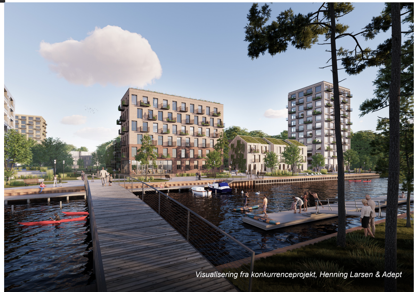
Visualisering fra konkurrenceprojekt, Henning Larsen & Adept

Byrum og landskab er udarbejdet med fokus på kanten mellem vand og land, og dette synes at være en spændende ide, som tilfører bylivet et oplevelsesrigt baggrundstæppe. Spørgsmålet er, om det er nødvendigt at indtage havnerummet i den størrelsesorden, som projektet foreslår, eller om det havde