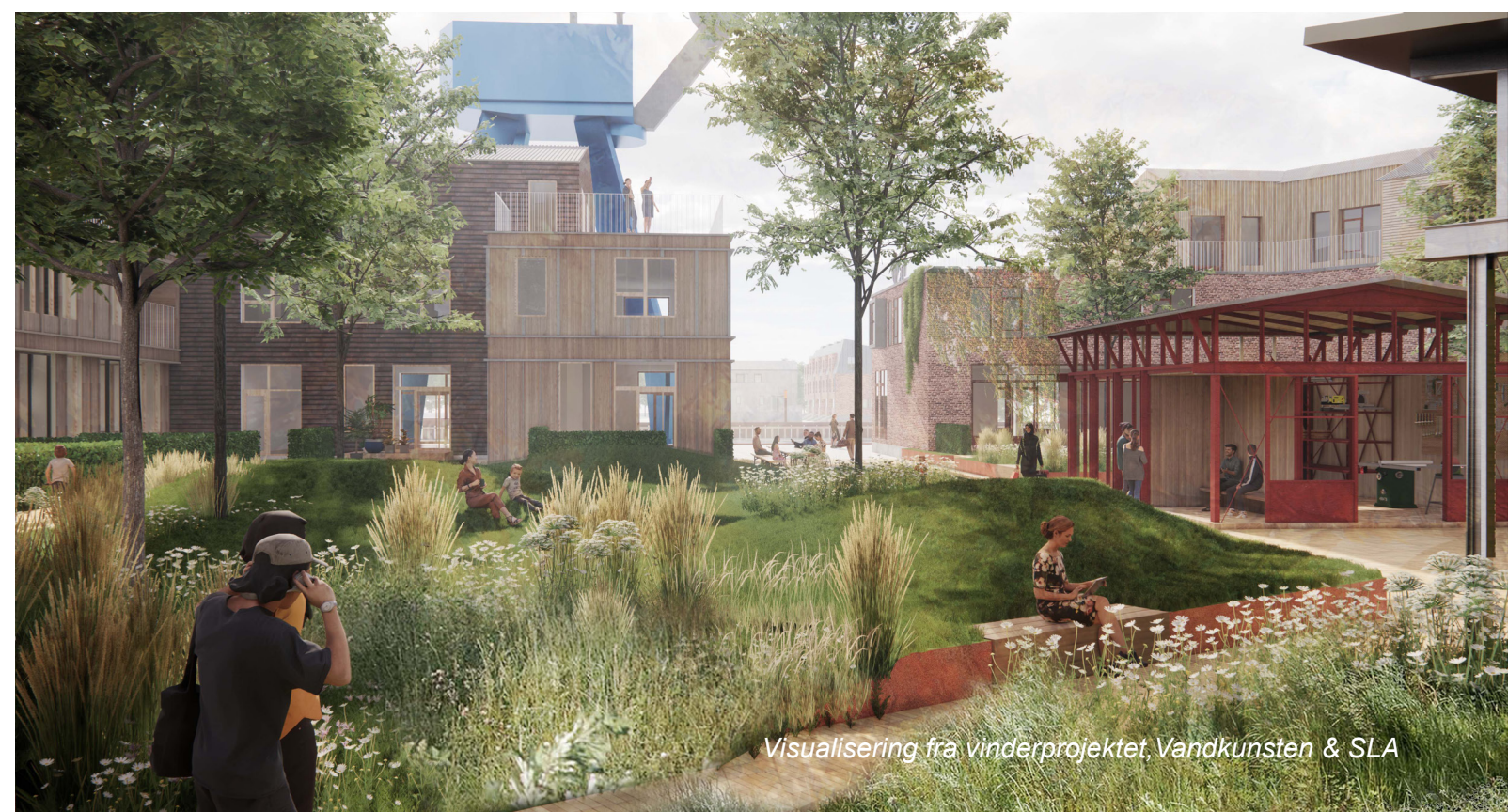
Visualisering fra vinderprojektet Vandkunsten & SLA

Der er mange hensyn, der skal afvejes, når rækkefølge (etapeplan) og udbygningstakt skal fastlægges. Der er både sammenhængen til den kommunale boligudbygningsplan og bosætningsstrategi, markedsmæssige forhold og økonomi, grundlaget for udadvendte funktioner, hensynet til eksisterende og kommende beboere og besøgende, byggepladsveje og midlertidige funktioner. Der skal derfor være et særligt fokus på rækkefølge og udbygningstakt i bearbejdningen af Vandkunsten og SLAs forslag.