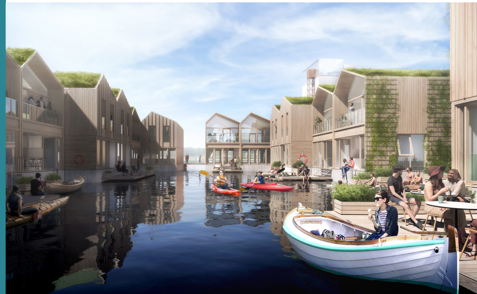
Visualisering fra konkurrenceprojekt, Henning Larsen & Adept

Ideerne om at indtage havnens vandareal til rekreative områder og bebyggede arealer synes samtidig at pege på potentialer og udfordringer, og man kan spørge, om havnen