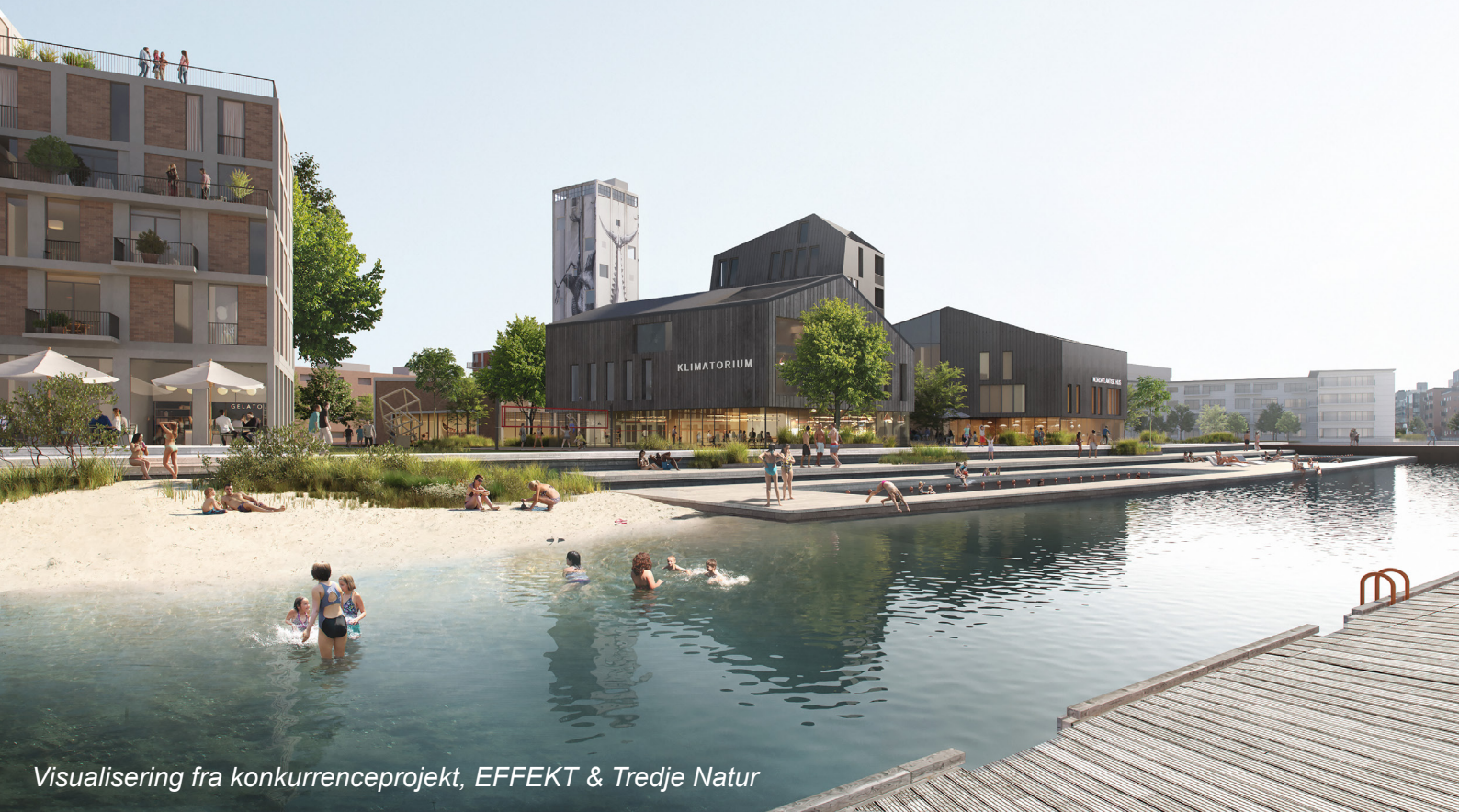
Visualisering fra konkurrenceprojekt, EFFEKT & Tredje Natur

være med til at skabe en bymæssig attraktion i Odense. Der savnes et tydeligt hierarki i planen og en tydelig stillingtagen til, hvor man mødes, hvor bylivet understøttes, og hvor der er mere rolige bokvaliteter.