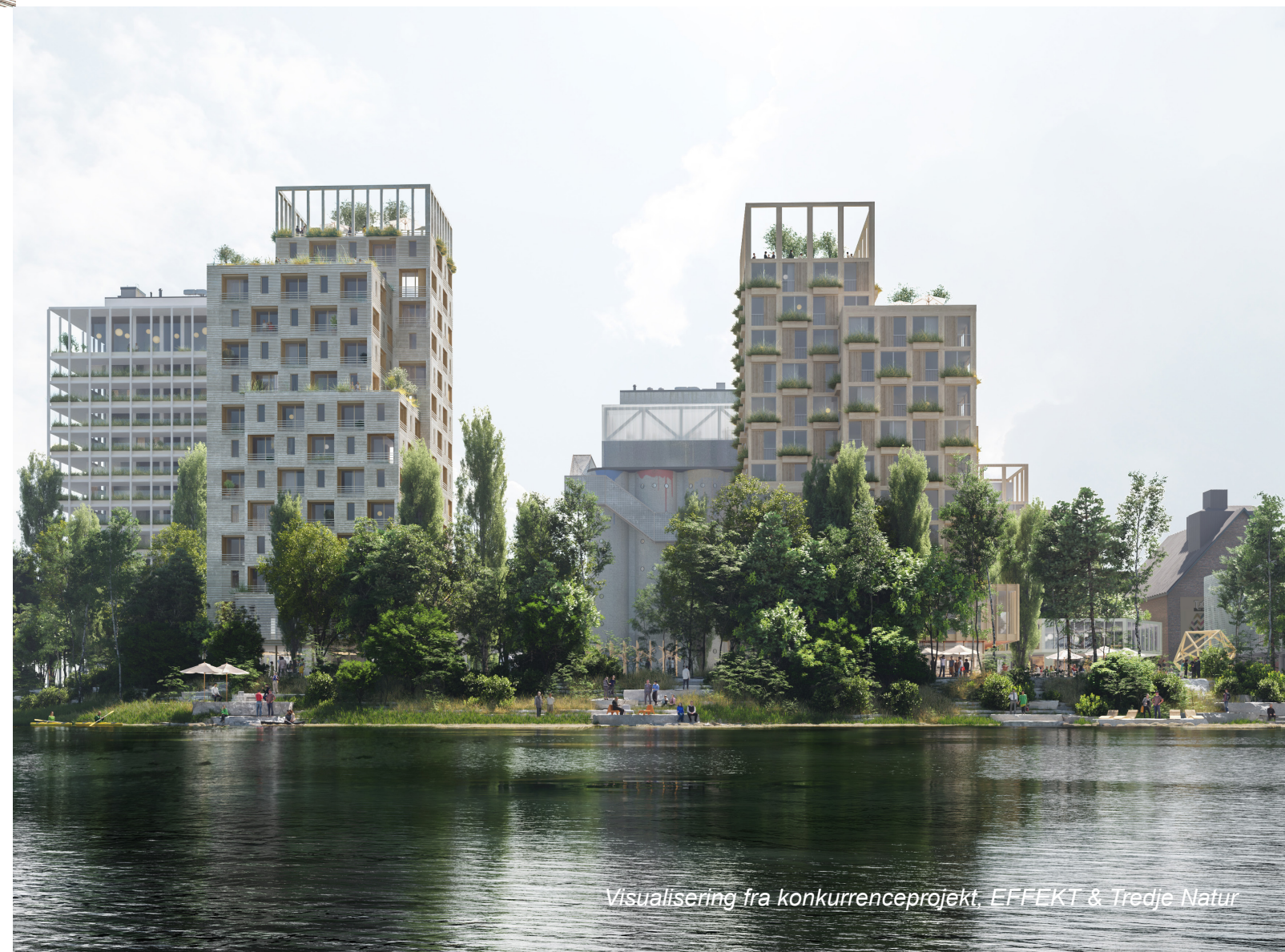
Visualisering fra konkurrenceprojekt, EFFEKT & Tredje Natur

Forslaget er gennemarbejdet og vurderes realiserbart i sin hovedstruktur. Men på grund af den lidt ensartede og skematiske tilgang til bebyggelsesplanen vurderes det – ud fra en helhedsplansbetragtning – at forslaget ikke er det bedst egnede at gå videre med. Der mangler særlighed, variation inden for hvert område, herlighedsværdi og oplevelsesværdi samt tydelige hierarkier for byrum og byliv. Men der er flere gode ideer i forslaget, som kan bringes i spil i det videre arbejde med bydelsudviklingsplanen. Det drejer sig blandt andet om forbindelsen til byen ved den grønne kile og tankerne om en havnestrånd, som det kan være interessant at undersøge mulighederne for. Hertil kommer det grundige arbejde med bylivsanalysen.