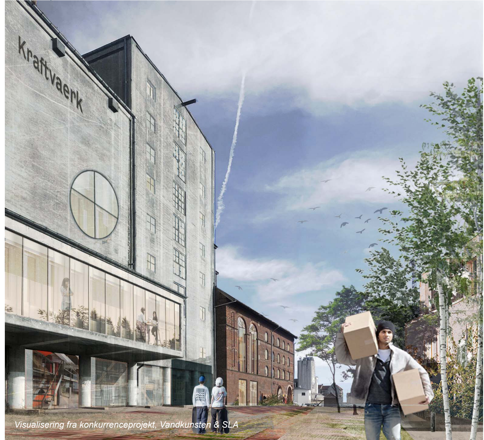
Visualisering fra konkurrenceprojekt, Vandkunsten & SLA

Der savnes dog en overbevisende fortælling om børneinstitutionens potentiale med sin placering for enden af den grønne kile som forbindelse til Odense centrum. Friareal kravet til institutionen kan blive en barriere for kontakten til havnen og vil dermed ikke blive det samlede rum, der lægges op til. Det er derfor vigtigt, at der enten findes en alternativ lokation eller at institutionen inkl. udearealer udformes, så disse får størst mulig brugsværdi for byens borgere uden for dagtimerne og i weekenden.