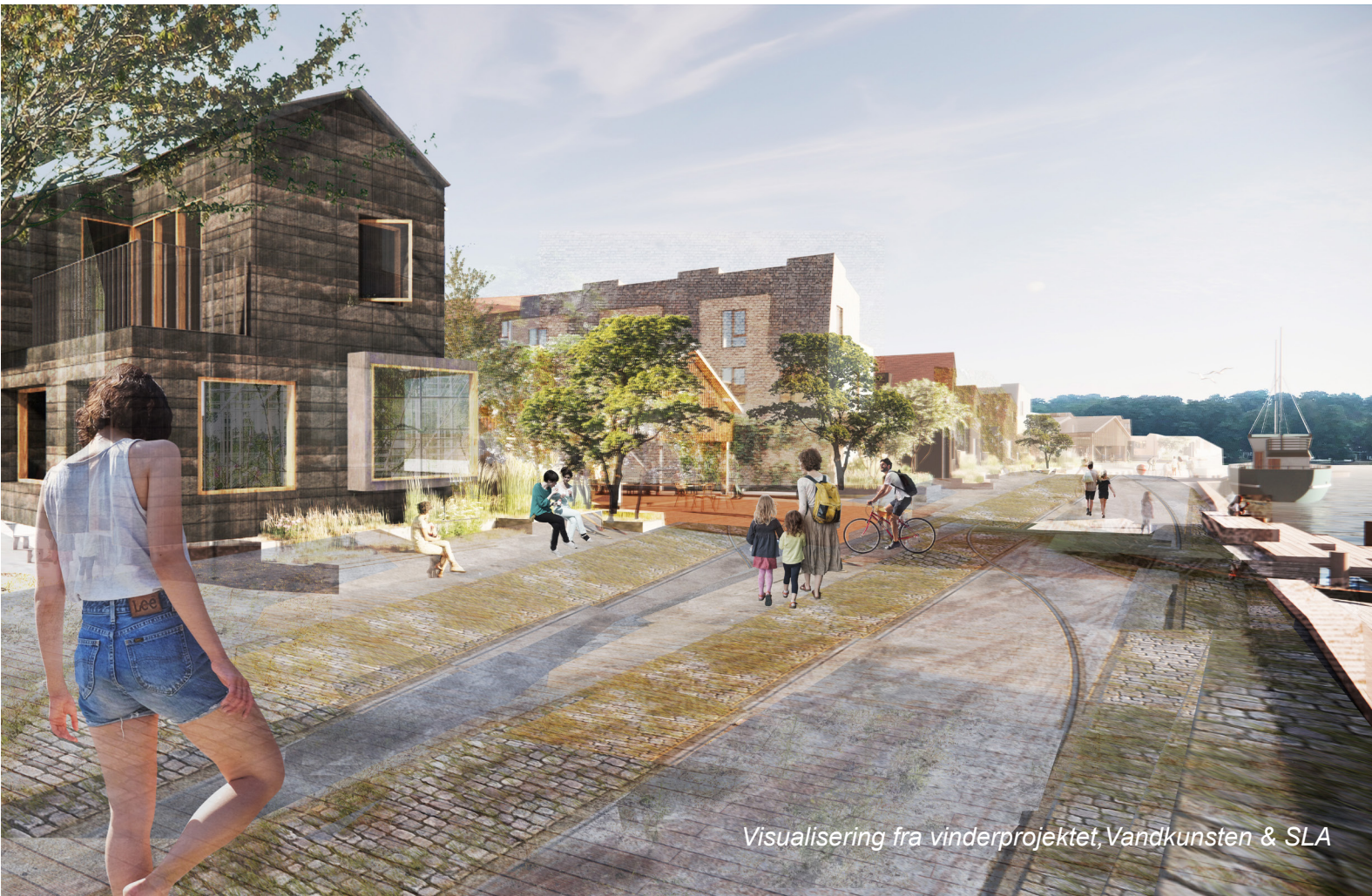
Visualisering fra vinderprojektet, Vandkunsten & SLA