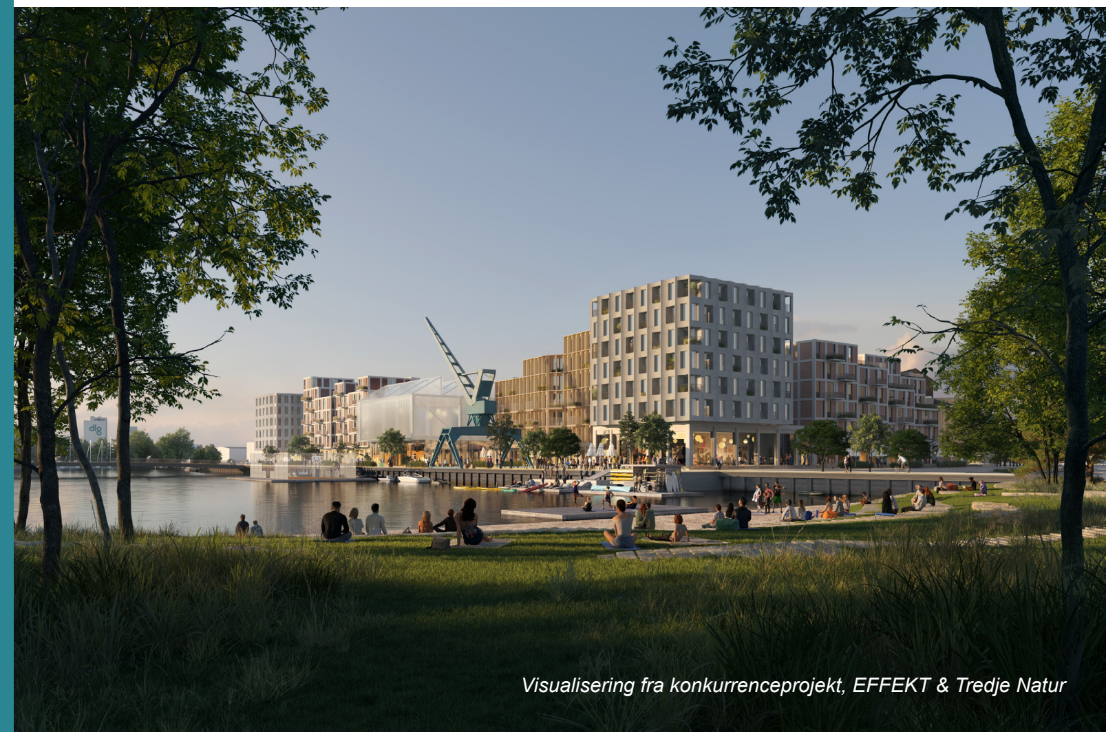
Visualisering fra konkurrenceprojekt, EFFEKT & Tredje Natur

Det er svært at få øje på, hvad det er der, gør dette sted helt særligt - og hvad der kan