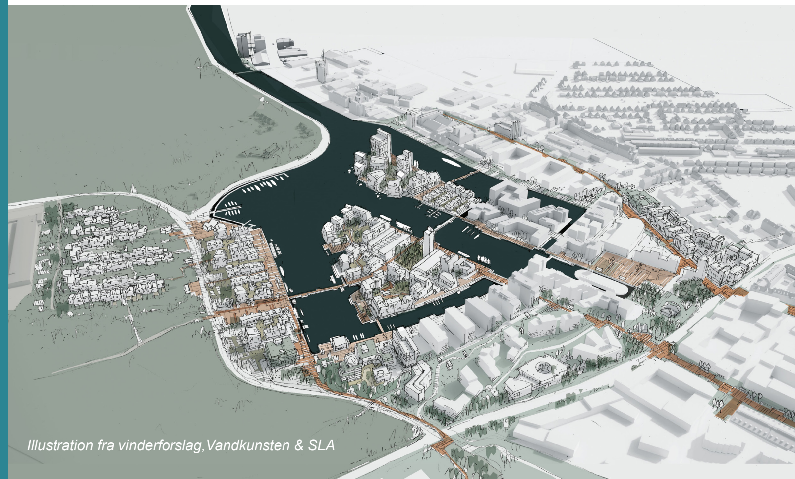
Illustration fra vinderforslag, Vandkunsten & SLA