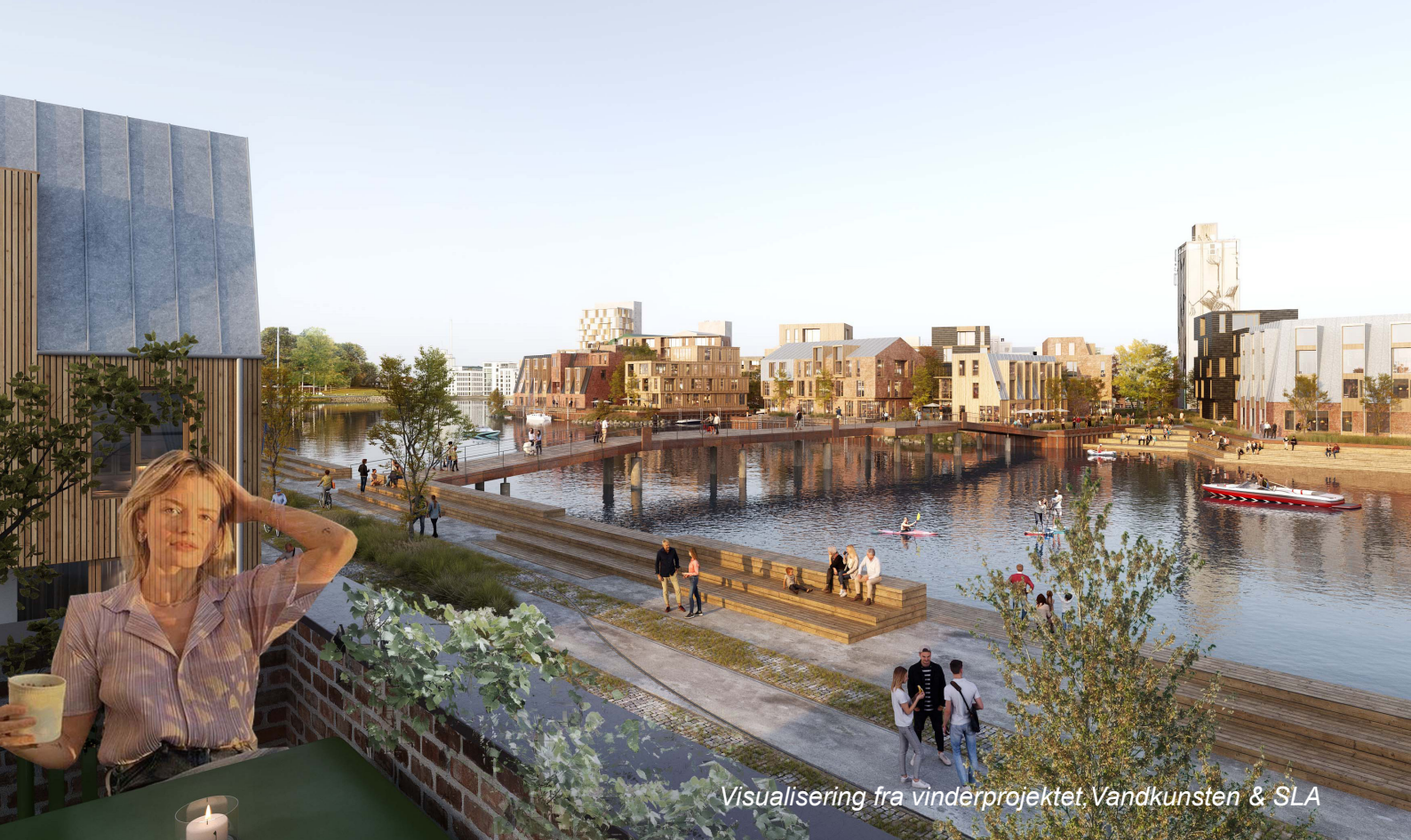
Visualisering fra vinderprojektet Vandkunsten & SLA

Høj tæthed kan samtidig medvirke til at skabe økonomisk råderum i byudviklingen til de mange ting, som borgere og interessenter med rette forventer – arkitektur af høj kvalitet, ny infrastruktur som eksempelvis broer, smukke byrum, bevaring og transformation af eksisterende bygninger osv.