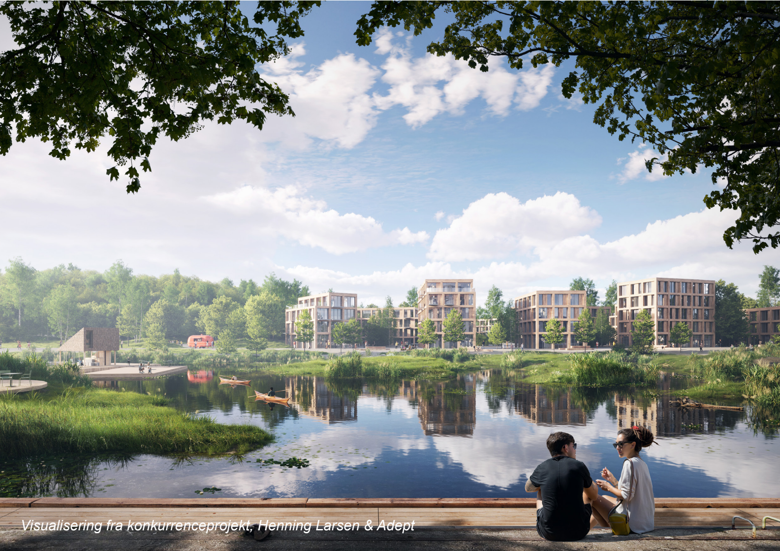
Visualisering fra konkurrenceprojekt, Henning Larsen & Adept

ændrer karakter fra store åbne vandrum til en kanalby, når store vandarealer inddrages. Projektets fokus på at bygge ud i havnen og koncentrere opmærksomheden omkring disse områder efterlader resten af planens bebyggelse noget ensartet og uovervejende i forhold til stedernes karakterer og potentialer.