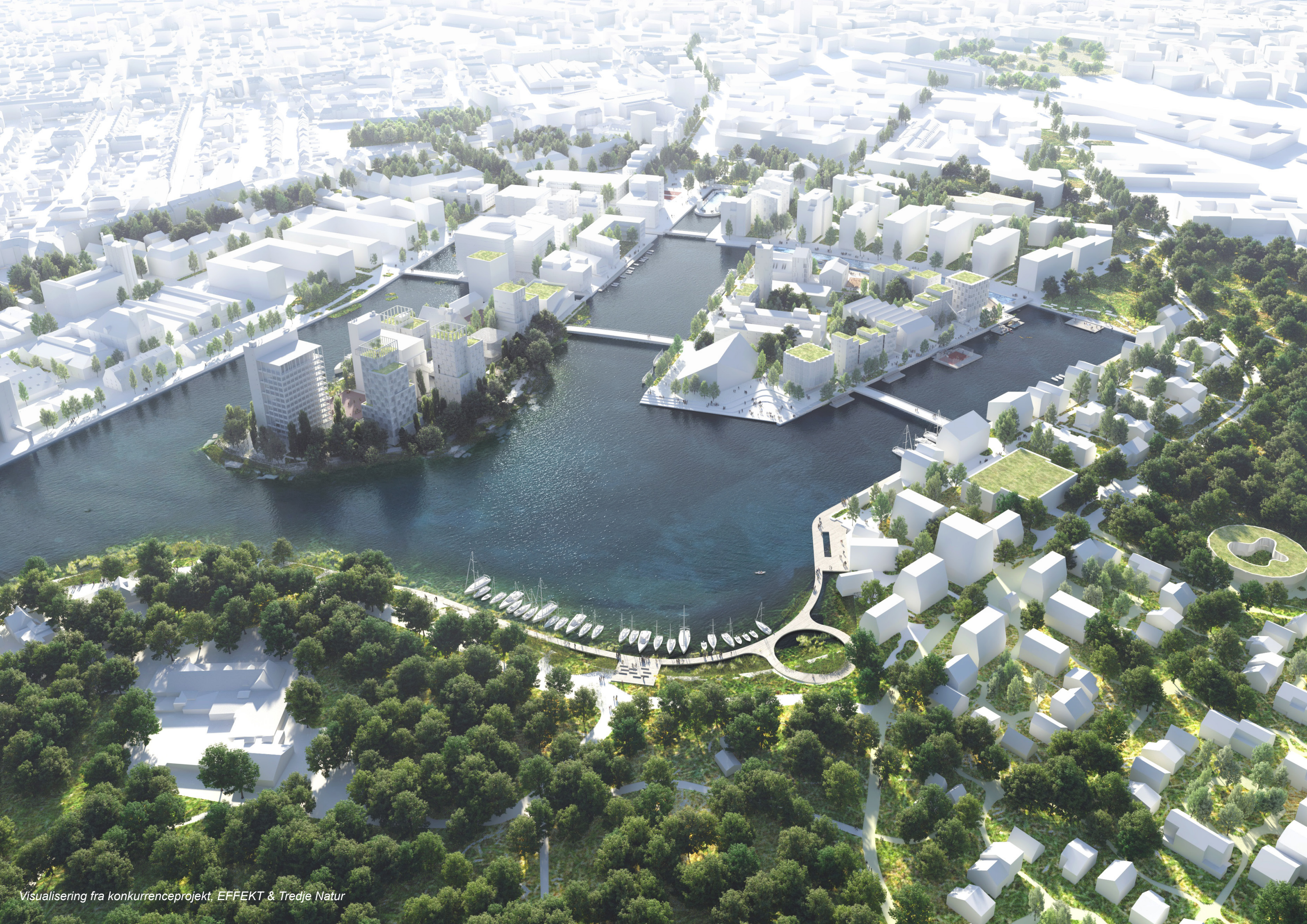
Visualisering fra konkurrenceprojekt, EFFEKT & Tredje Natur