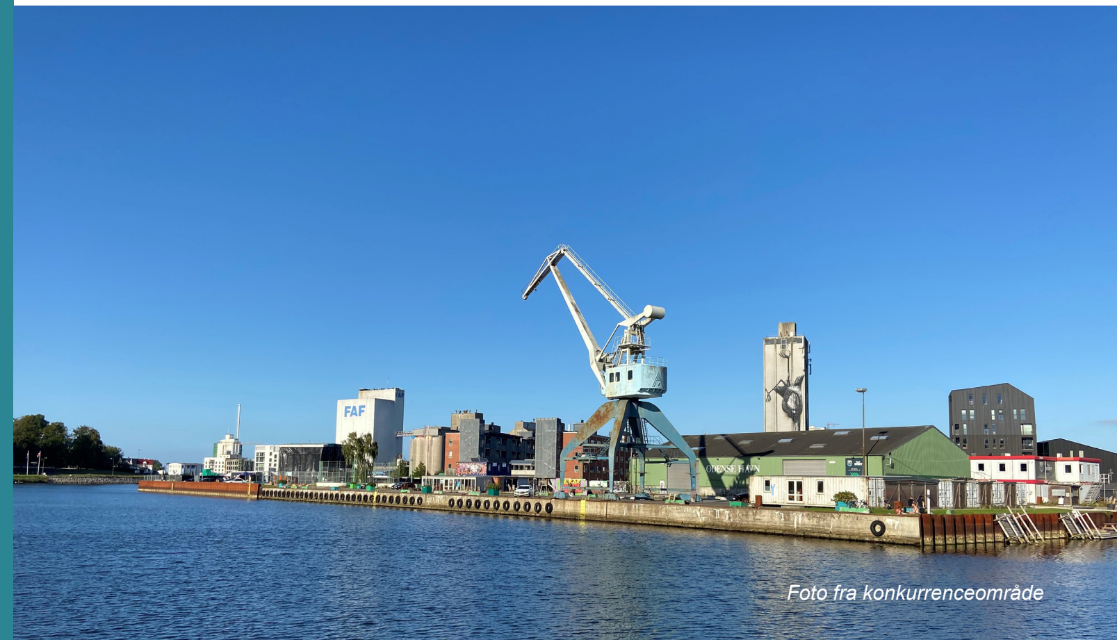
Foto fra konkurrenceområde